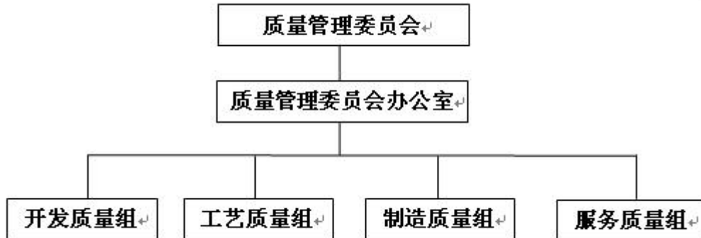
图 2 海信日立质量管理机构