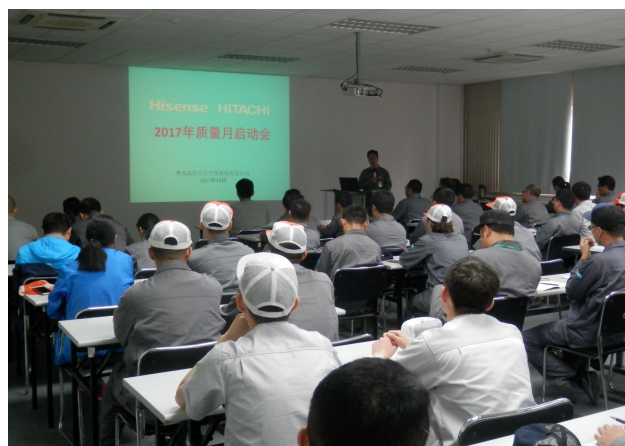
图 4 2017 年质量月启动会场景

公司的质量文化建设贯穿于企业产品实现的始终，公司通过总经理讲话、各级会议、宣传栏、质量教育、质量责任制、质量活动、质量改善和激励等多种方式，将“立于信、精于业、行于勤”的经营理念，以及质量意识的建立和提升，层层深入至各级人员，并不断强化质量氛围。如：每年开展“质量月”活动，面向全员的 QC 小组活动、质量改善项目、课题、重大质量隐患发现、质量培训计划、提速 B 计划等。