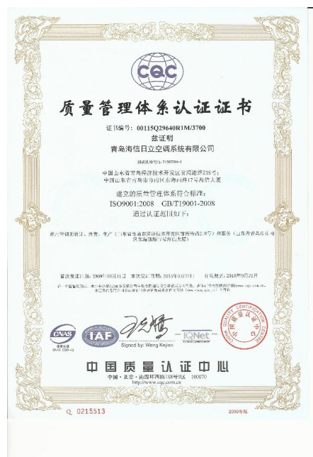
图 3 质量管理体系证书

公司管理者代表是由公司一名副总经理担任，负责整体推进体系的建立、保持和持续改进，按期实施内审并接收外部监督认证审核。