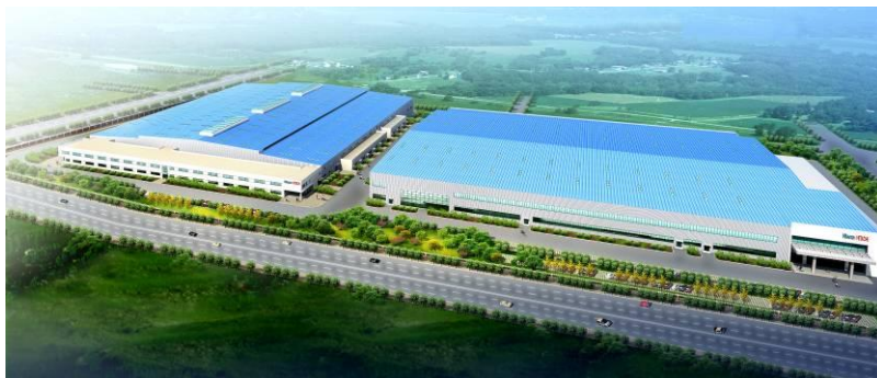
图 1 海信日立厂区全景效果图

能力，在全面掌握世界领先的核心技术的基础上，不断推出先驱性的新型节能环保空调产品。公司积极推行专业技术、专业制造、专业营销、专业设计、专业服务、专业管理的经营体系，引领空调技术不断进步，为人类创造一个更美好的生活空间。