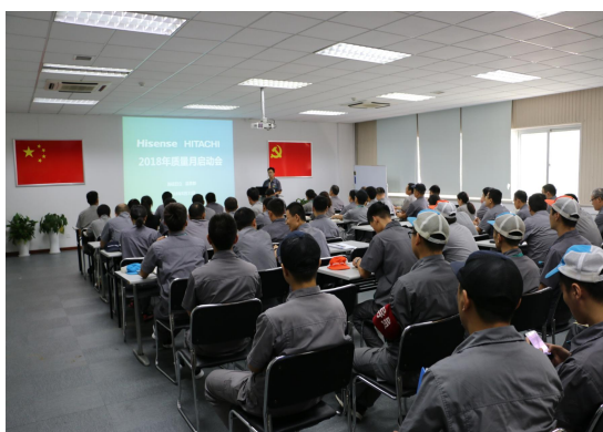
图 4 2018 年质量月启动会场景

公司的质量文化建设贯穿于企业产品实现的始终，公司通过总经理讲话、各级会议、宣传栏、质量教育、质量责任制、质量活动、质量改善和激励等多种方式，将“立于信、精于业、行于勤”的经营理念，以及质量意识的建立和提升，层层深入至各级人员，并不断强化质量氛围。如：每年开展“质量月”活动，面向全员的 QC 小组活动、质量改善项目、课题、重大质量隐患发现、质量培训计划、提速 B 计划等。