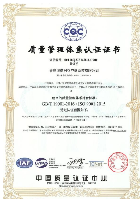
图 3 质量管理体系证书

公司管理者代表是由公司一名副总经理担任，负责整体推进体系的建立、保持和持续改进，按期实施内审并接收外部监督认证审核。